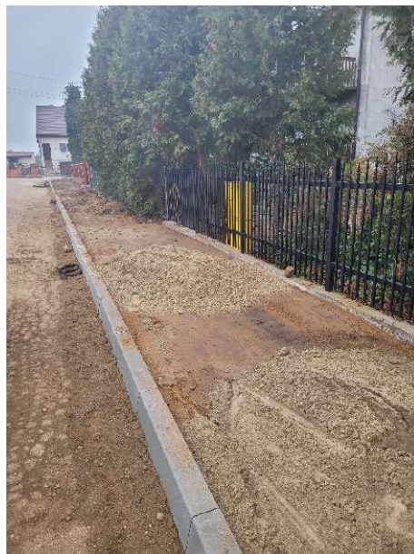
Przebudowa ulicy Łozy w Radzanowie

Uwzględniając wydatki na wieloletnie programy inwestycyjne w latach 2022-2025 Gminy Radzanów zaplanowano przebudowę boiska do piłki nożnej w Radzanowie oraz przebudowę ciągu ulic: Łozy, Floriańskiej i Sienkiewicza w miejscowości Radzanów wraz z kanalizacją na ulicy Sienkiewicza.