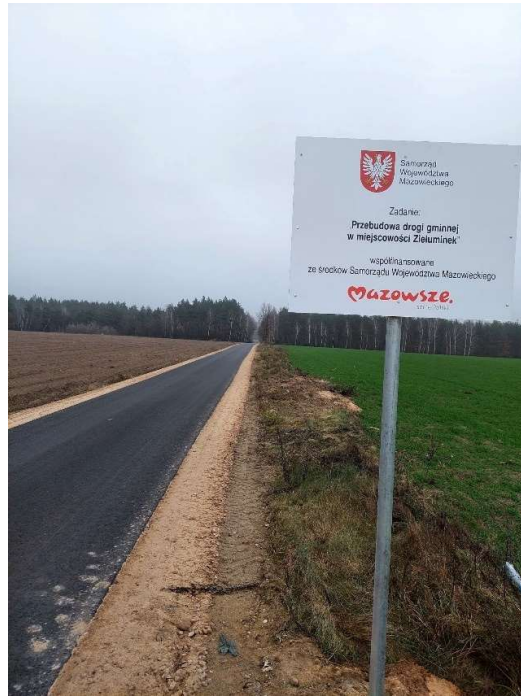
Przebudowa drogi w Zieluminku