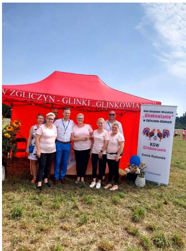
Koło Gospodyń Wiejskich „Glinkowanie” w Zgliczynie-Glinkach

Wójt Gminy Radzanów wspierał również koła wędkarskie w ich działaniach pomagając między innymi w przygotowaniu zawodów wędkarskich.