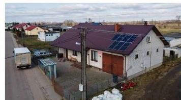
Instalacje fotowoltaiczne na budynkach gminnych