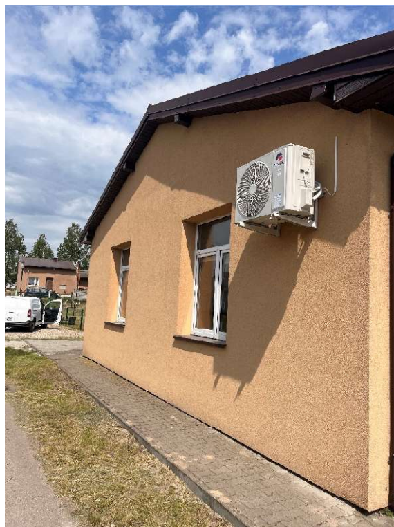
Modernizacja w budynku - montaż instalacji grzewczo-wentylacyjnej