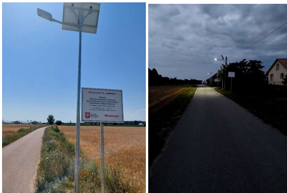
Lampy solarne w Gradzanowie Zbęskim Kolonia i Bieżanach

W ramach dbałości o środowisko zakupiono również kolejne w naszej gminie uliczne lampy solarne. Posadzone zostały w Bieżanach i Gradzanowie Zbęskim-Kolonia.