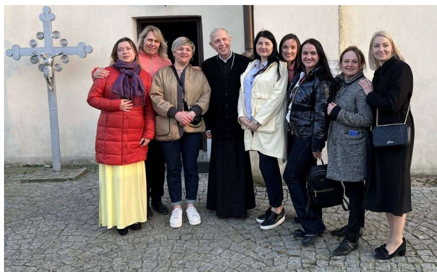
Wizyta Biskupa w Ratowie

Nasi mieszkańcy udzielali również Ukraińcom schronienia we własnych domach. Zakwaterowanie uchodźcy znaleźli również w sanktuarium w Ratowie, gdzie odwiedził ich Biskup Diecezji Płockiej.