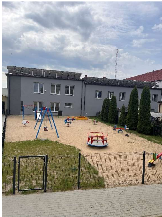
Plac zabaw przy Przedszkolu w Radzanowie

Budynek przedszkola otrzymał instalację fotowoltaiczną, która pozwoli zaoszczędzić energię elektryczną, a co za tym idzie obniżyć koszty utrzymania przedszkola oraz odnowiony plac zabaw.