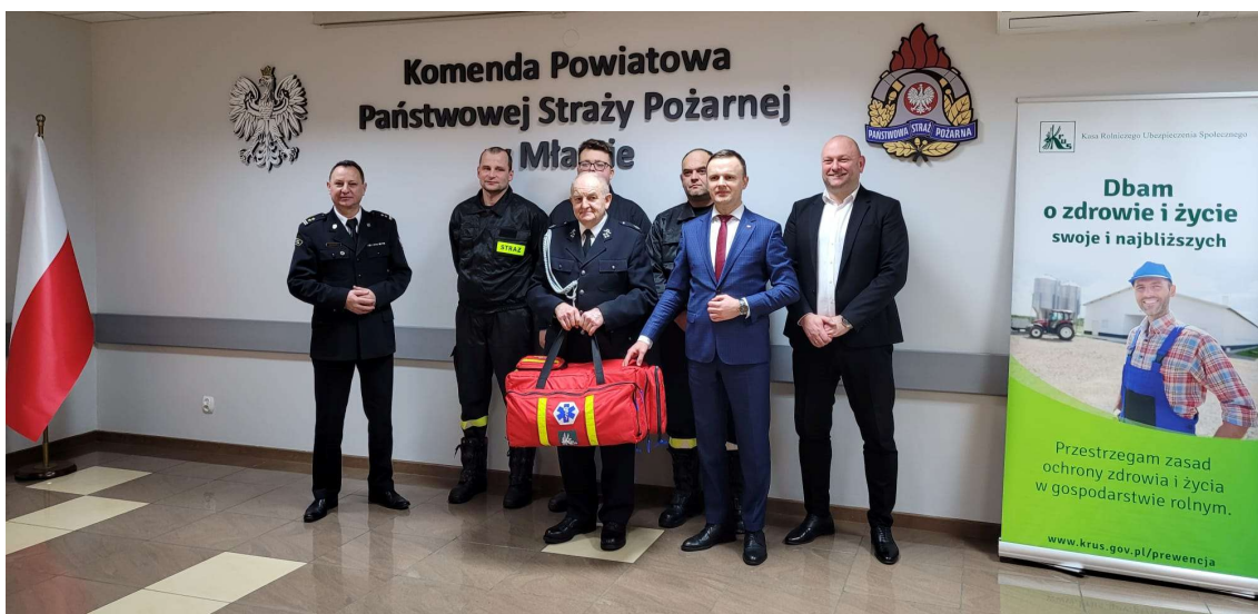
Przekazanie torby medycznej

Nasi drzewnicy OSP otrzymali również nowe wyposażenie w postaci torby medycznej jak też odzieży ochronnej dofinansowanej przez Samorząd Województwa Mazowieckiego.