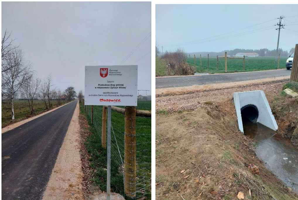
Przebudowa drogi w Zgliczynie Witowym