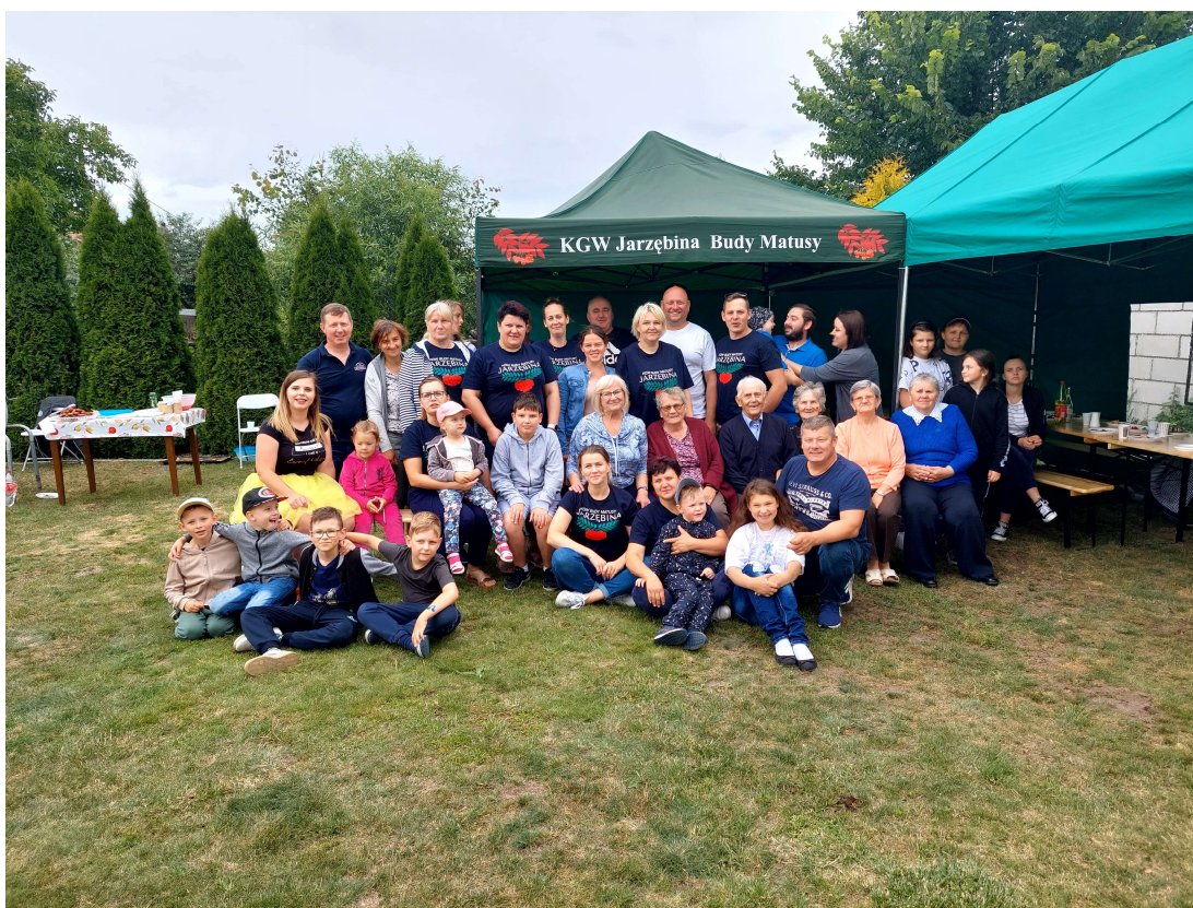
Koło Gospodyń Wiejskich „Jarzębina” w Budach Matusach

W kolejnym konkursie udział wziął klub sportowy z terenu gminy Radzanów, a był to UKS Wkra Radzanów. W ramach realizacji zadania klub zorganizował dwa turnieje piłki nożnej o nazwie „Radzanów Football Cup Kids 2022” dla grupki ok. 100 dzieci z terenu Gminy Radzanów. Zostały zorganizowane dwa wyjazdy na pływalnię do Mławy w którym brało udział ok. 90 dzieci i młodzieży.