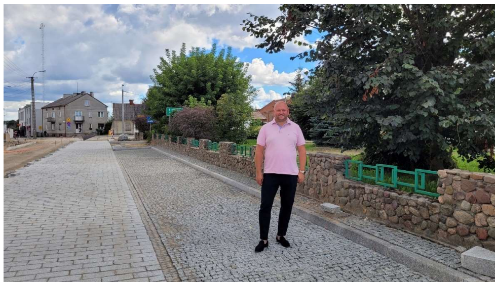
Przebudowa drogi powiatowej -część przy Placu Piłsudskiego

Zakończono też inwestycję dofinansowaną przez Gminę Radzanów polegającą na przebudowie drogi powiatowej wraz z budową nowoczesnej ścieżki rowerowej od Radzanowa w kierunku Drzazgi, która nie tylko poprawiła bezpieczeństwo ruchu kołowego ale też pieszych i dzięki ścieżce dla rowerzystów.