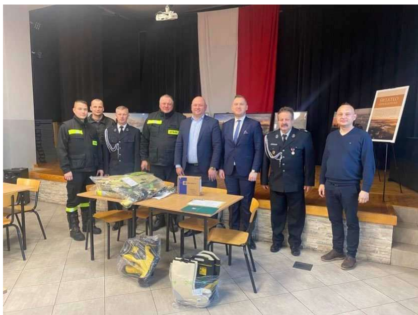
Nowa odzież ochronna dla OSP

Gmina Radzanów skorzystała z dofinansowania na remont starego garażu OSP w Radzanowie w ramach programu „Mazowieckie strażnice OSP-2022”.