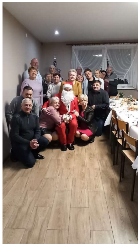
Koło Gospodyń Wiejskich „Józefinki” w Józefowie