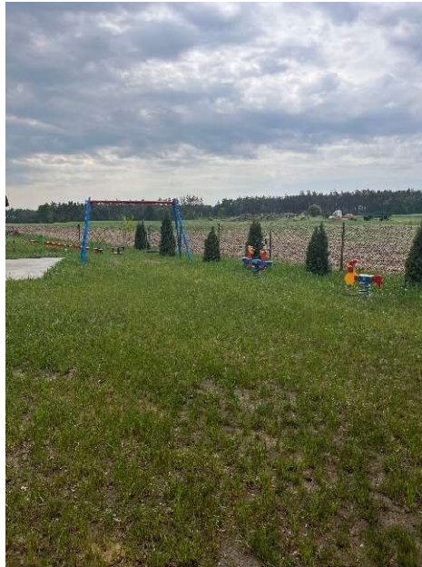
Plac zabaw w Józefowie

Dzięki zaangażowaniu mieszkańców i pomocy Gminy powstał nowy plac zabaw w miejscowości Józefowo.