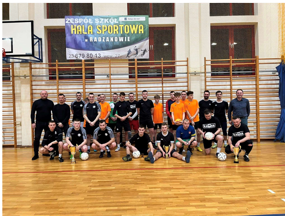
Zawody o Puchar Wójta Gminy Radzanów

Do czynnego wyczynku Wójt Gminy zachęcał mieszkańców inicjując zawody sportowe.