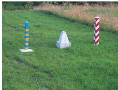
Odbiór uchodźców -Granica polsko-ukraińska Krościenko

Nasi mieszkańcy udzielali również Ukraińcom schronienia we własnych domach. Zakwaterowanie uchodźcy znaleźli również w sanktuarium w Ratowie, gdzie odwiedził ich Biskup Diecezji Płockiej.