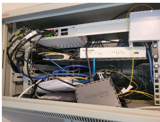
Nowoczesna serwerownia w Urzędzie Gminy

Raportowany rok był kolejnym, na który miała wpływ sytuacja związana z pandemią COVID-19 jednakże w dużo mniejszym stopniu niż w 2021. Doświadczenie pracy zdalnej zarówno w pracy urzędniczej jak też i w nauce spowodowało, że Gmina Radzanów przystąpiła do następnego etapu cyfryzacji, poprzez wdrożenie programu grantowego „Cyfrowa Gmina” finansowanego ze środków Programu Operacyjnego Polska Cyfrowa na lata 2014-2022 Osi Priorytetowej V Rozwój cyfrowy JST oraz wzmocnienie odporności na zagrożenia REACT-EU działania 5.1 Rozwój cyfrowy JST oraz wzmocnienie cyfrowej odporności na zagrożenia. W ramach projektu doposażono Urząd Gminy w nowe komputery przenośne oraz bardzo nowoczesną serwerownię.