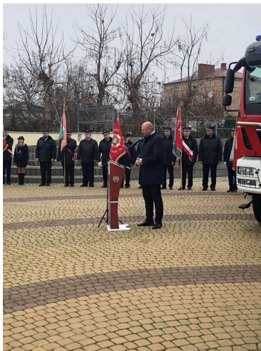
Przekazanie samochodu dla OSP

Nasi drzewnicy OSP otrzymali również nowe wyposażenie w postaci torby medycznej jak też odzieży ochronnej dofinansowanej przez Samorząd Województwa Mazowieckiego.