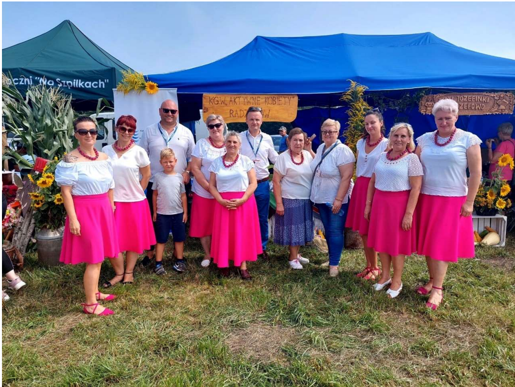
Koło Gospodyń Wiejskich w Radzanowie n/Wkrą „Aktywne Kobiety”